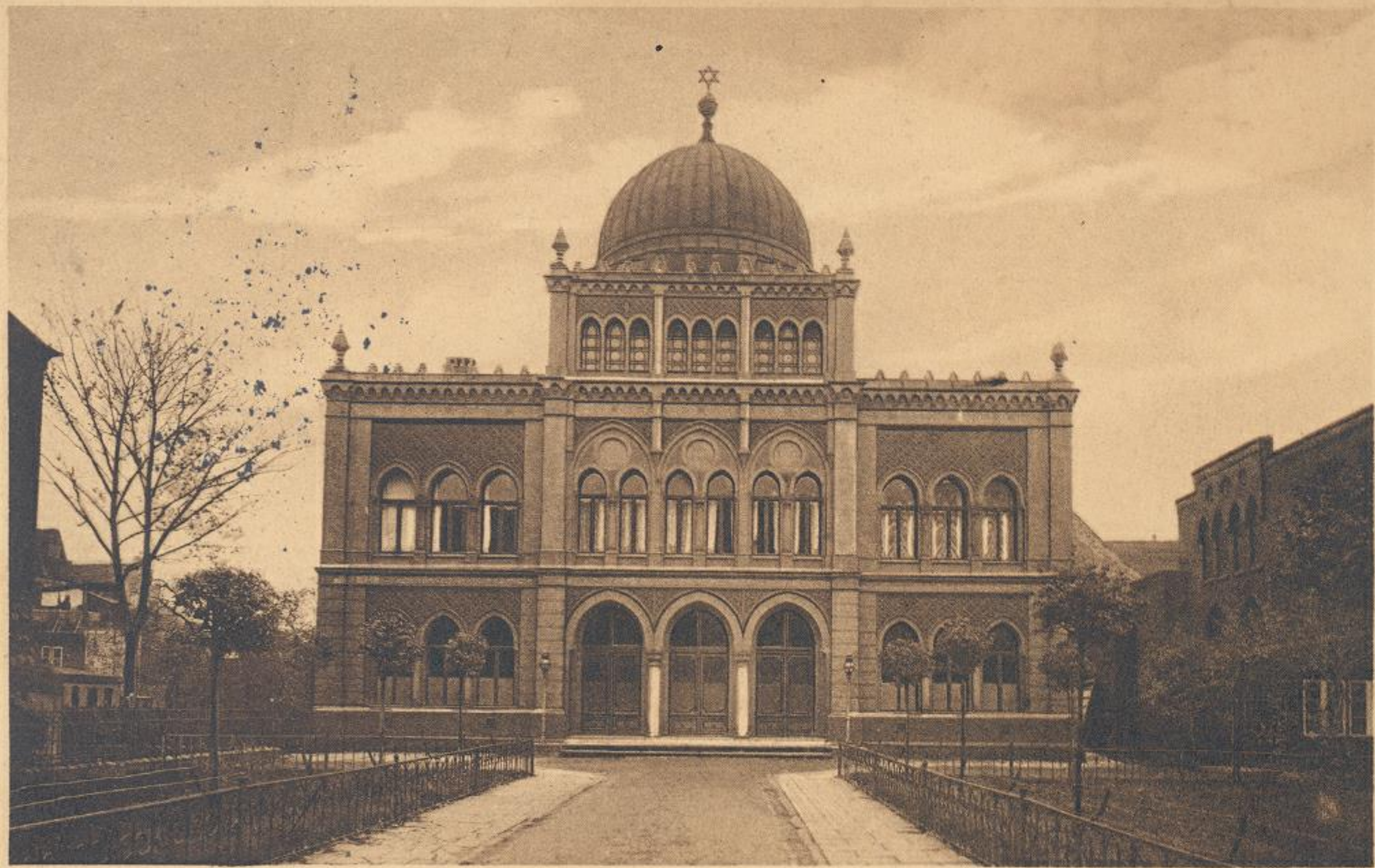
LÜBECK — Synagoge